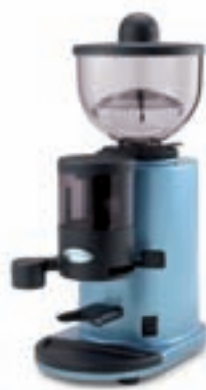
sky blue MT